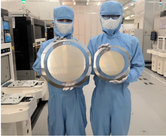
خط الإنتاج لمعالجة الرقائق المصنوعة من السيليكون بحجم ١٢ بوصة (رقاقة بحجم ٨ بوصات على اليمين)

يُتوقع أن يدعم الإمداد المستقر لشرائح أشباه موصلات الطاقة المصنوعة من السيليكون التحول الأخضر