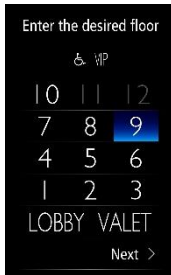
صورة شاشة تعمل باللمس

طوكيو، ٤ نوفمبر ٢٠٢١ - أعلنت شركة Mitsubishi Electric Corporation (طوكيو: ٦٥٠٣) اليوم عن إطلاق مصعد 2 Diamond-Trac®، وهو مصعد جديد آلي ذو حجم أقل من الغرف من سلسلة Diamond-Trac® والذي يتميز بتصميم موفر للمساحة وكفاءة تشغيلية محسنة ولوحة تشغيل بدون لمس في الردهة للمسكن والمكاتب والفنادق في سوق الولايات المتحدة. ستبدأ شركة Mitsubishi Electric US, Inc. مبيعاتها في ١٢ نوفمبر، مستهدفة مضاعفة المبيعات السنوية في هذه الفئة سنويًا.