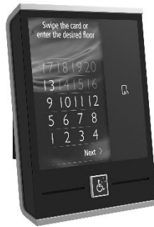
لوحة تشغيل بدون لمس في الردهة