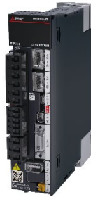
مضخم الإشارات في أنظمة