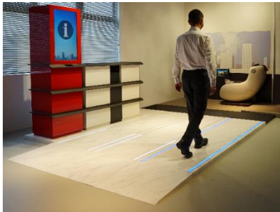
نظام تحصيل الأجرة بدون عوائق في المحطة

طوكيو، ٢٠ نوفمبر ٢٠١٧ – أعلنت شركة Mitsubishi Electric Corporation (طوكيو: ٦٥٠٣) اليوم عن مجموعة متنوعة من الحلول الابتكارية لإضفاء مزيد من الراحة وسهولة الاستخدام على محطات السكك الحديدية و عربات القطار، ويشمل ذلك إضافة تحسينات مثل نظام لتحصيل الأجرة بدون عوائق في المحطات، وخدمات شخصية على متن القطار، وغيرها الكثير. وسيتم عرض هذه التصورات الابتكارية في معرض Mass-Trans Innovation Japan 2017 الذي يُقام في مجمع معارض ماكوهارى ميسه في مدينة تشيبا باليابان، وذلك في الفترة من ٢٩ نوفمبر وحتى ١ ديسمبر.