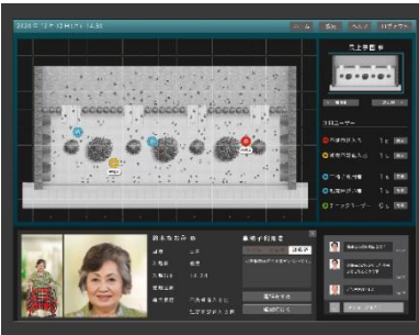
شاشة المراقبة الأمنية لمتابعة التحركات داخل المحطة