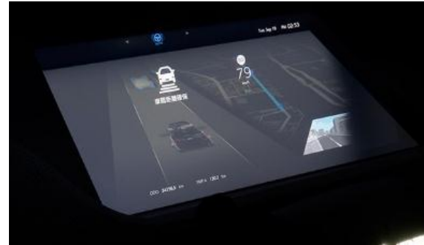
شاشة عرض بانورامية