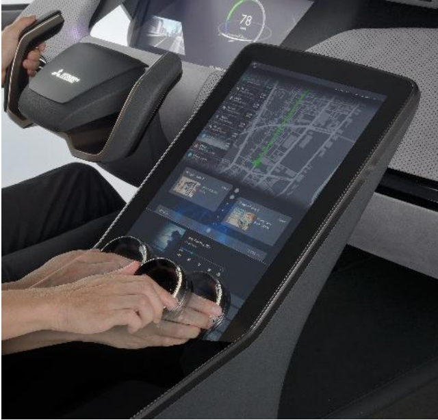
شاشة مزودة بمقبض