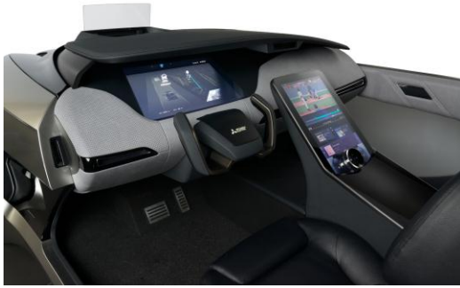
الجزء الداخلي لسيارة EMIRAI 4

طوكيو، ١٦ أكتوبر ٢٠١٧ – كشفت شركة Mitsubishi Electric Corporation (طوكيو: ٦٥٠٣) اليوم النقاب عن سيارتها التجريبية EMIRAI 4 التي تدعم الجيل التالي من تقنيات المساعدة على القيادة، الذي يُتوقع أن يساعد على الحد من حوادث المرور ويساهم في إيجاد وسائل انتقال أكثر أمنًا وملاءمة ومراعاة للبيئة. وسيتم عرض EMIRAI 4 خلال معرض طوكيو للسيارات الخامس والأربعين لعام ٢٠١٧ في مجمع معارض Tokyo Big Sight في الفترة من ٢٧ أكتوبر وحتى ٥ نوفمبر.